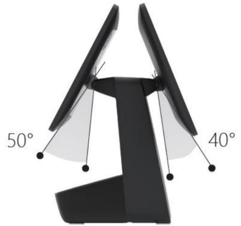
Appareil à double écran 15,6+15,6 pouces, L x P x H : 380 x 250 x 375