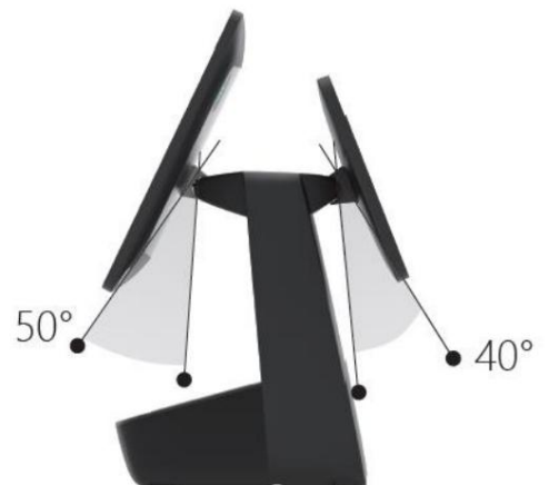
Appareil à double écran 15,6 + 10,1 pouces L x P x H : 380 x 250 x 375